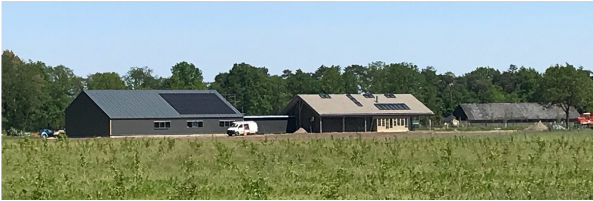
Het in aanbouw zijnde landgoed

Brabant. Dat deel van het landgoed wordt ook toegevoegd aan het Natuurnetwerk Brabant. “Wij zijn heel blij met de toekenning van de subsidie, maar vooral ook over hoe er met ons is meegedacht over hoe wij het het beste konden aanpakken.”